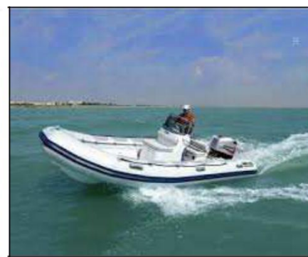
Ein- und Ausschiffung