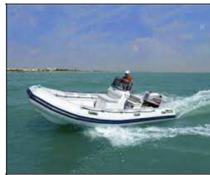
Ein- und Ausschiffung